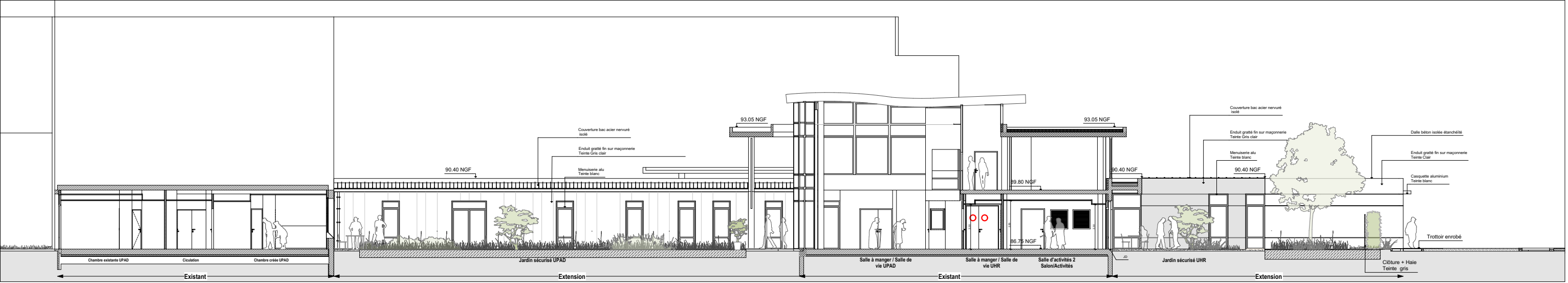
Façade Sud -Patio